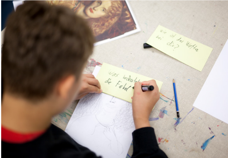
Ein Schüler richtet Fragen an Helene von Troja für den Chatbot.

So sollten die Inhalte der Ausstellung für Jugendliche unerwartet und interessant vermittelt werden. Schüler*innen der 10. Klasse setzten sich hierfür ein Schulhalbjahr lang mit der Ausstellung auseinander. Sie trafen eine Werkauswahl, entwickelten Kriterien für die Ansprache von Jugendlichen, erarbeiteten Fragen und Antwortvorschläge sowie abwechslungsreiches Bildmaterial. Die technische Umsetzung erfolgte mithilfe des assono KI-Chatbots und nutzte die Spracherkennung von IBM Watson.