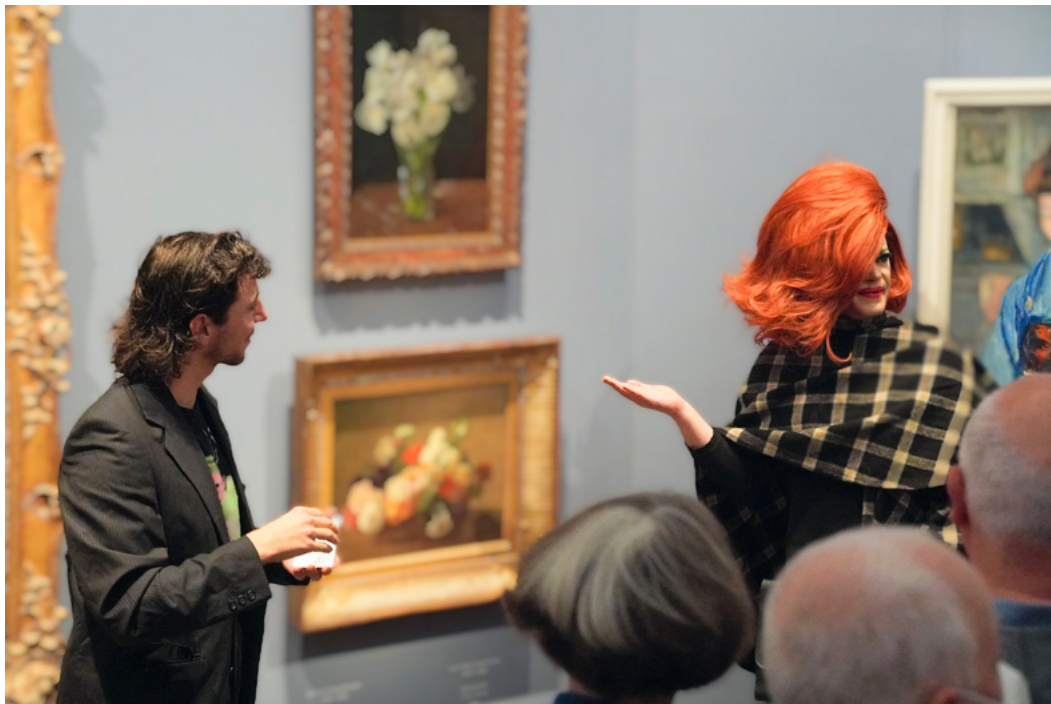
Eine sogenannte Dragführung in der Hamburger Kunsthalle.

14:00 Uhr: Diskussion und Fragerunde / Pause