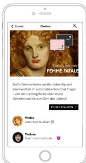
Screenshot des Chatbots auf Smartphone. GuidePilot aus Potsdam, 2023

Gemeinsam mit der Wüstenrot Stiftung als Kooperationspartner sowie in Zusammenarbeit mit der Stadtteilschule am Hafen, Standort St. Pauli, entstand vor knapp einem Jahr, im Rahmen der Ausstellung Femme fatale. Blick – Macht – Gender (09.12.2022 bis 10.04.2023), ein Chatbot, der automatisiert Fragen von Besucher*innen beantwortete. Die sechs Chat-Persönlichkeiten stellten historische Bezüge zu den Kunstwerken und ihren Entstehungsgeschichten her, wurden aber als fiktive Figuren frei erdacht.