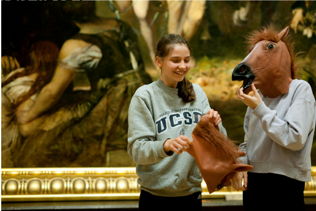
Zwei Mädchen setzen Pferdekopfmasken vor Hans Makarts Gemälde Der Einzug Kaiser Karl V. in Antwerpen auf.