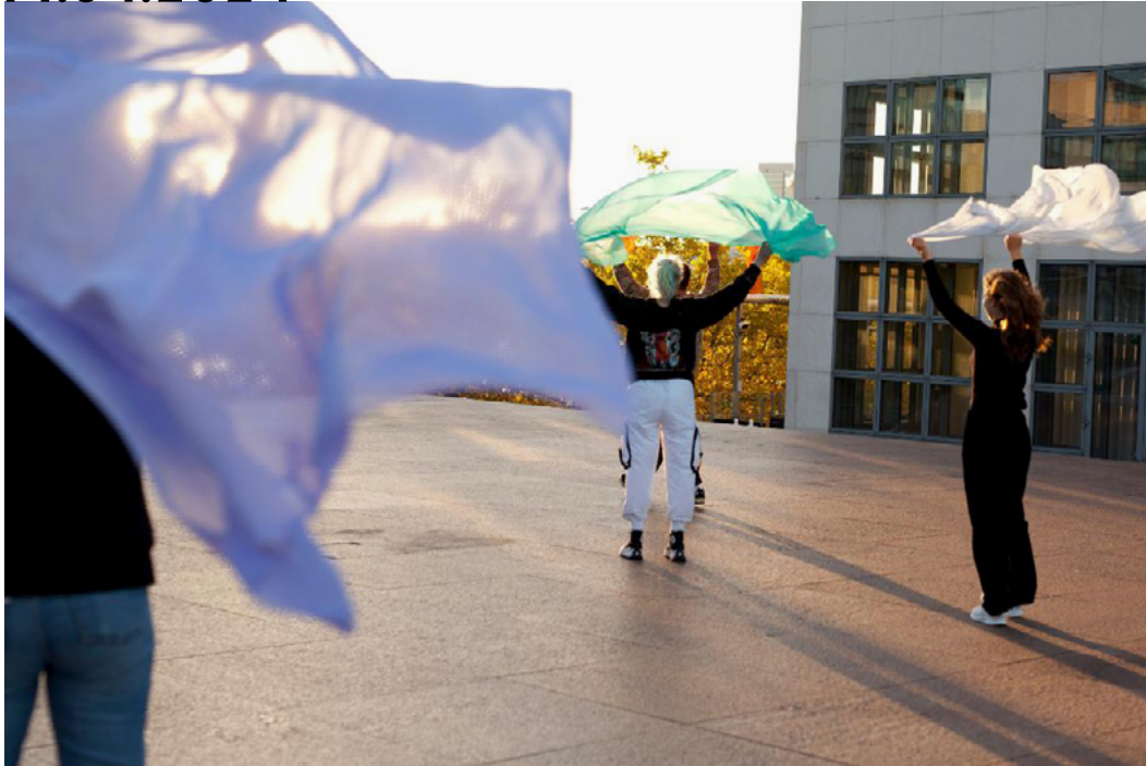
Teilnehmer*innen an einem von mehreren Workshops mit dem Titel Makart x Dance tanzen auf der Plattform zwischen Altbau und Galerie der Gegenwart der Hamburger Kunsthalle.