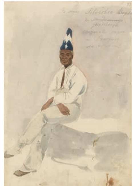
Der schwarze Korporal · 1829

Carl Blechen (1798-1840) galt schon seinen Zeitgenossen als ein Phänomen. Sie bewunderten seine Genialität, zugleich jedoch provozierte er das Publikum mit seinen formal und inhaltlich neuen Sichtweisen. Heute wird er international als einer der bedeutendsten Künstler des 19. Jahrhunderts geschätzt. Als Landschaftsmaler bezieht sich Blechen motivisch und inhaltlich auf die Romantik, insbesondere auf Caspar David Friedrich und Johan Christian Clausen Dahl. Im Malerischen weist er jedoch weit über seine Zeit hinaus. Blechens Kunst verbindet eine Frühform realistischer Wahrnehmung mit einer Technik der Pleinairmalerei, die zu dieser Zeit und in dieser Form in Europa neu ist. Für diese Kombination gibt es weder direkte Vorläufer noch unmittelbare Nachfolger.