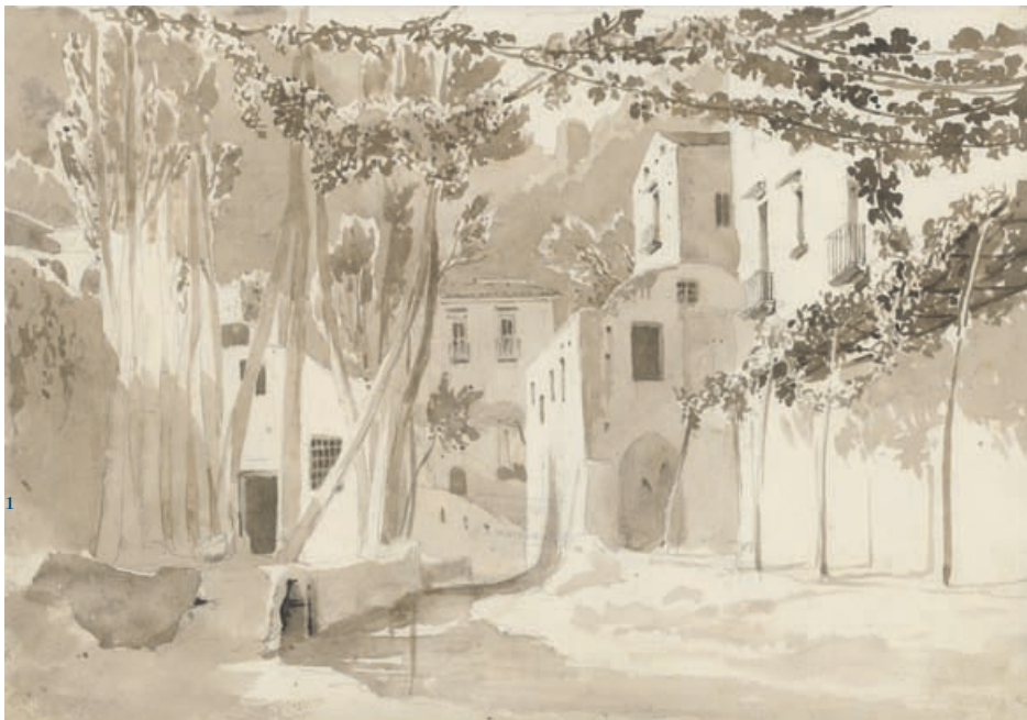
Wasserlauf zwischen Häusern · 1829