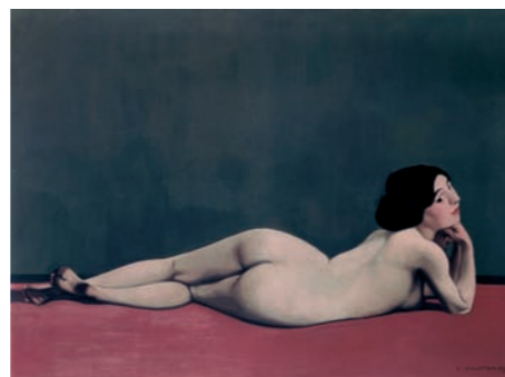
Liegender Akt auf rotem Teppich, 1909, Musée du Petit Palais, Genf