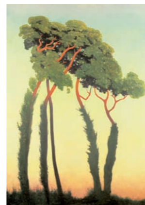
Letzte Sonnenstrahlen, 1911, Musée des beaux-arts, Quimper