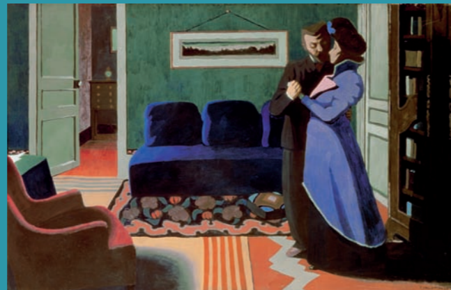
Der Besuch, 1899, Kunsthhaus Zürich