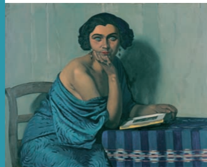
Vom Meer zurück, 1924, Musée d'art et d'histoire, Genf

Die Ausstellung, die in Kooperation mit dem Kunsthaus Zürich entstanden ist, versammelt mehr als 70 Gemälde und über 50 Holzschnitte dieses faszinierenden, doch in Deutschland zu unrecht wenig bekannten Künstlers.