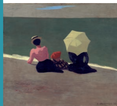
Am Strand, 1899, Privatbesitz