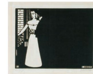
Das Geld, 1898, Graphische Sammlung der ETH Zürich