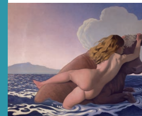
Die Entführung der Europa, 1908, Kunstmuseum Bern