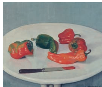
Rote Pfefferfrüchte, 1915, Kunstmuseum Solothurn, Dübi-Müller-Stiftung