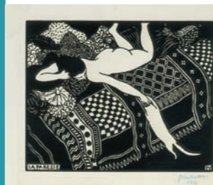
Die Trägheit, 1896, Graphische Sammlung der ETH Zürich